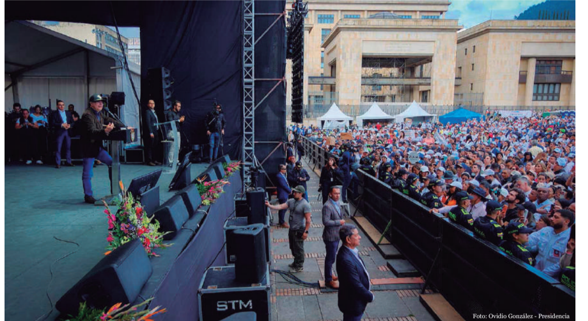
El presidente Gustavo Petro aseguró que los recursos de la salud han sido saqueados desde la Ley 100 de 1993.