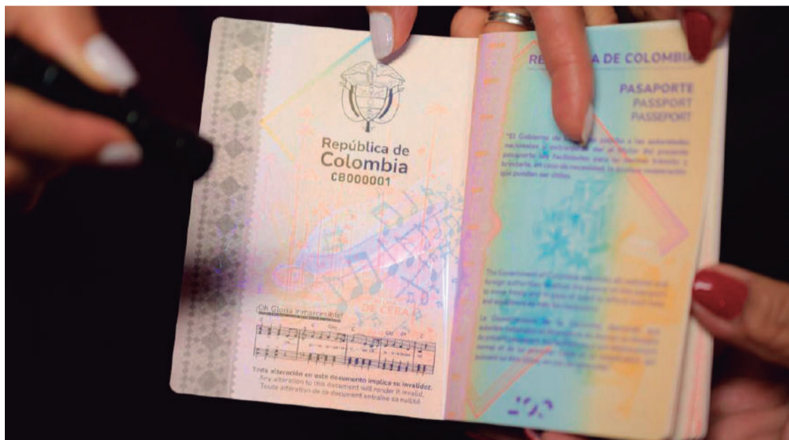
El Gobierno Nacional presentó el nuevo modelo de pasaporte colombiano

El jefe de Estado también resaltó los elementos culturales incluidos en el diseño. “Ustedes pueden ver figuras propias del mundo precolombino, de nuestro mundo natural o nuestra literatura; aquí pueden ver la bandera de Colombia, aquí las mariposas amarillas, siempre nos van a acompañar mariposas amarillas”, expresó. Además, aseguró que “es uno de