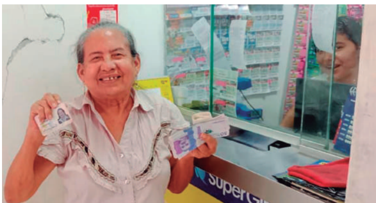
Prosperidad Social inició la entrega de las transferencias de los ciclos 1 y 2 del programa Colombia Mayor, que beneficiarán a más de 2,8 millones de personas mayores en todo el país.

Rodríguez Amaya afirmó que se está garantizando que millones de personas mayores en condición de vulnerabilidad reciban el apoyo económico que contribuye a mejorar su bienestar y calidad de vida. “Este esfuerzo reafirma el compromiso del