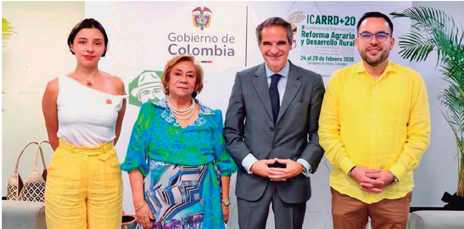
Encuentro de los ministros colombianos de Relaciones Exteriores, Agricultura, y Energía, con el director del Oiea.