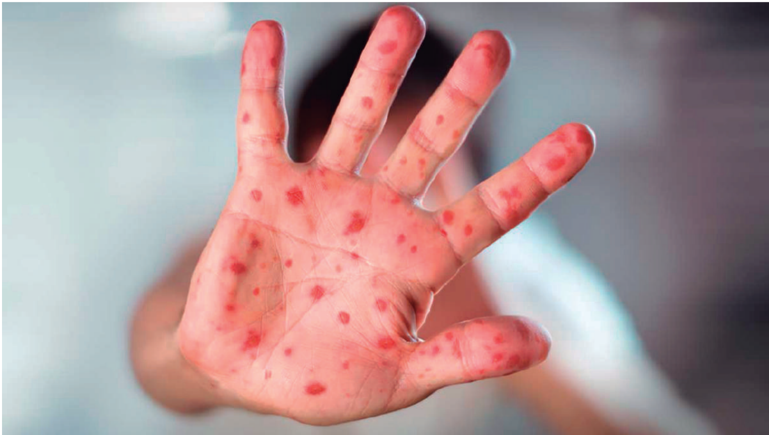
Refuerzo de vigilancia en aeropuertos, puertos y pasos terrestres para identificar personas con síntomas de sarampión como fiebre y rash o erupción en piel.