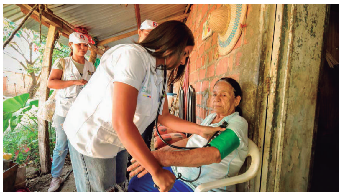
“El sistema preventivo permite mitigar la congestión en urgencias y abaratar, al prevenir la enfermedad, el costo total del sistema”: presidente Petro.