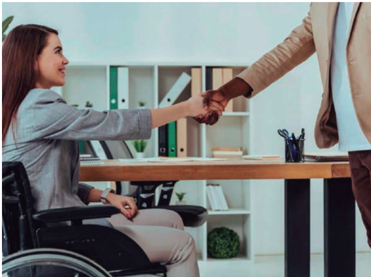
La medida pretende saldar una deuda histórica con la población en condición de discapacidad.

Además de ser una exigencia de ley, el borrador de decreto responde a la condena impuesta al Gobierno Nacional por parte del Consejo de Estado, mediante una acción de cumplimiento impetrada por un ciudadano, en la que se estableció que,