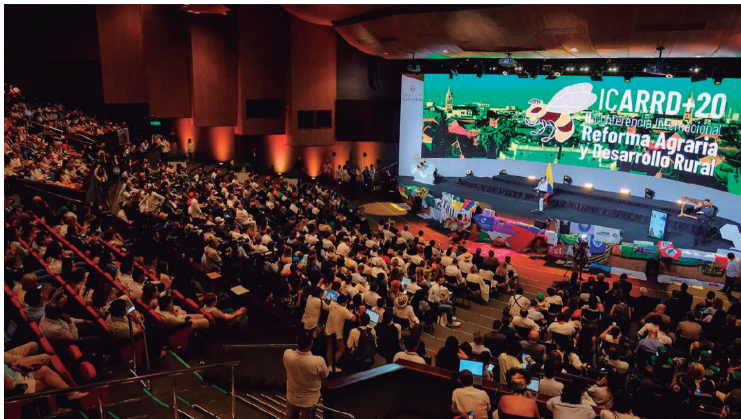
El presidente Gustavo Petro defendió la reforma agraria en Colombia como la mayor que se ha hecho en el mundo: con más de 700 mil hectáreas hasta ahora.